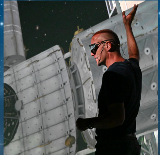
Deep Space (AEC – Ars Electronica Center, Linz)