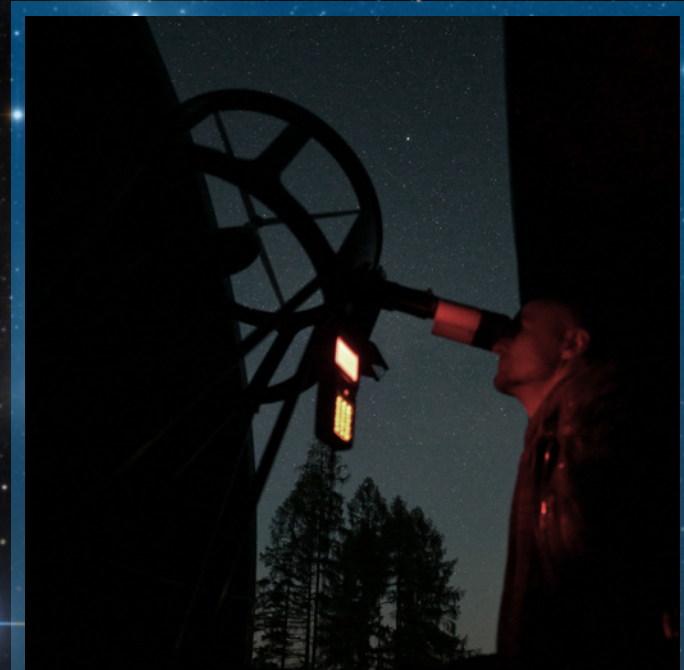
Sternderlschauen in der Sternwarte