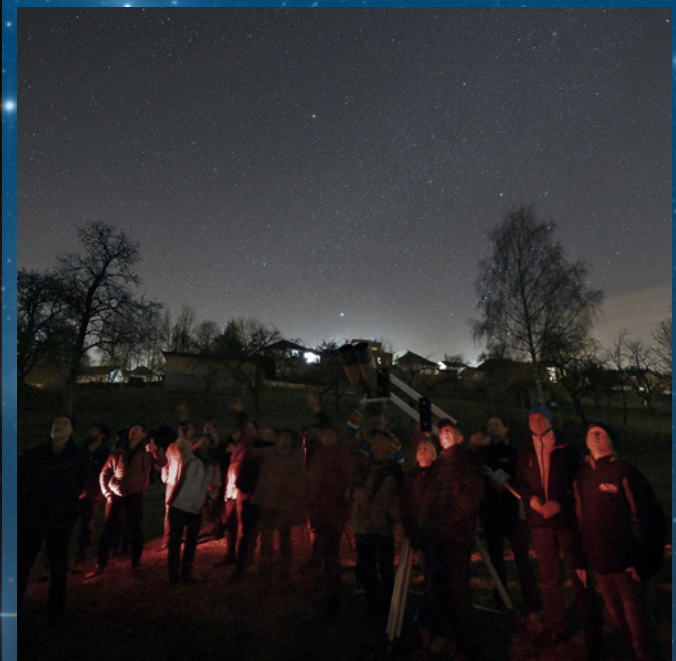
Links: Seminarraum in Linz, rechts: beim Sterne schauen