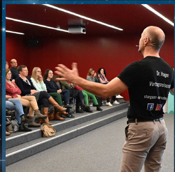
Seminarraum (AEC – Ars Electronica Center, Linz)