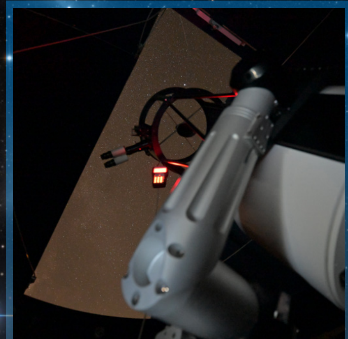
In der Sternwarte