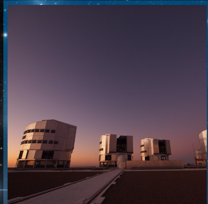
Paranal Observatory (Chile)