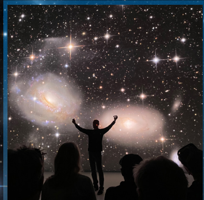
Deep Space (AEC – Ars Electronica Center, Linz)