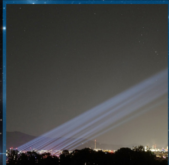
Linz bei Nacht