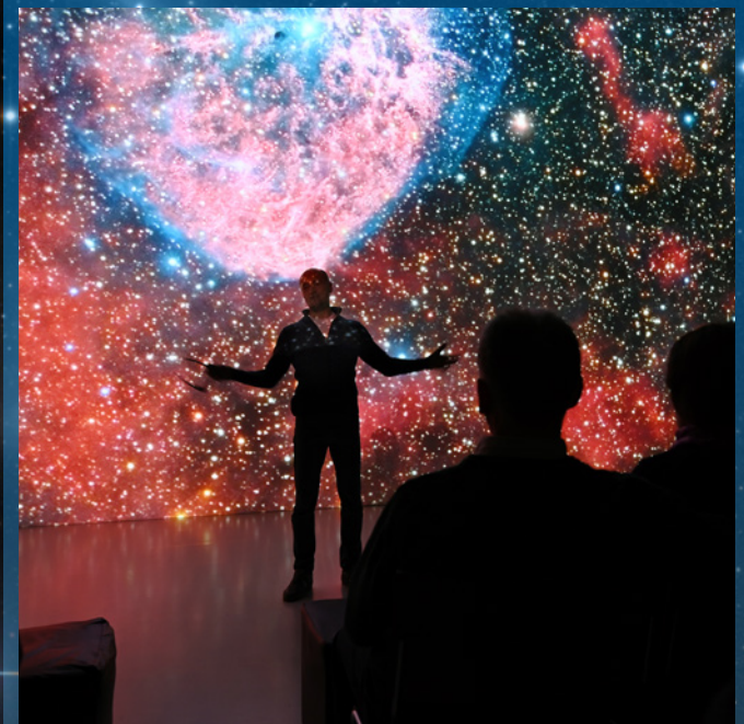
Deep Space (AEC – Ars Electronica Center, Linz)

Das Event zielt darauf ab, dass die Teilnehmer:innen langfristig die Bedeutung von Kommunikation, Vertrauen und Zusammenarbeit verstehen und umsetzen. Was sich metaphorisch in der Galaxis zeigt, wird methodisch in ein lebbares Konzept übersetzt, das auf der Relevanz eines gemeinsamen Ganzen beruht.