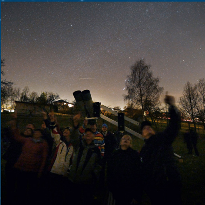
Sternderlschauen in der Sternwarte