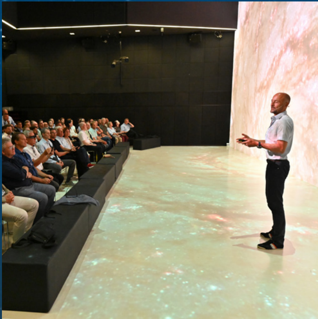
Deep Space (AEC – Ars Electronica Center, Linz)