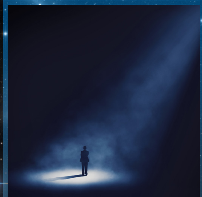
Das Ende der Nacht