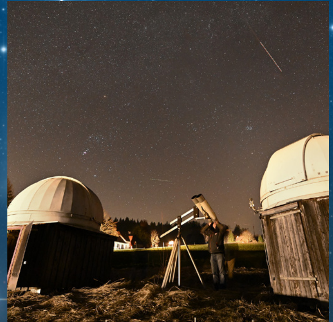
Sternderlschauen in der Sternwarte